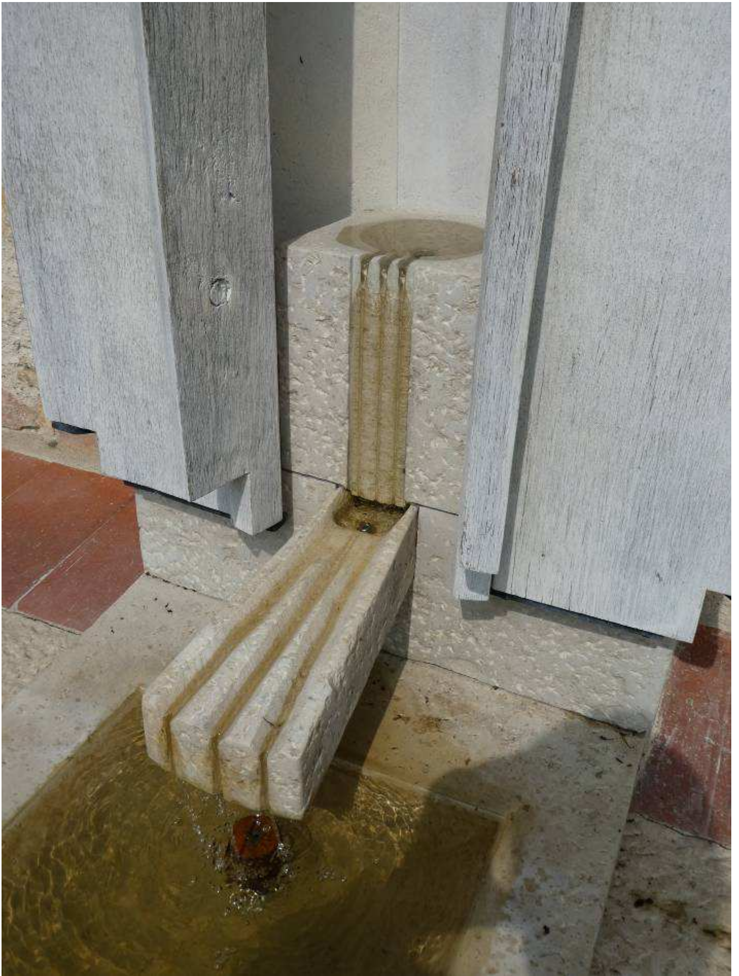
Vision vom dreifachen Brunnen (Wein, Öl, Honig) aus der Vision des Bruder Klaus im Kloster Heiligkreuztal