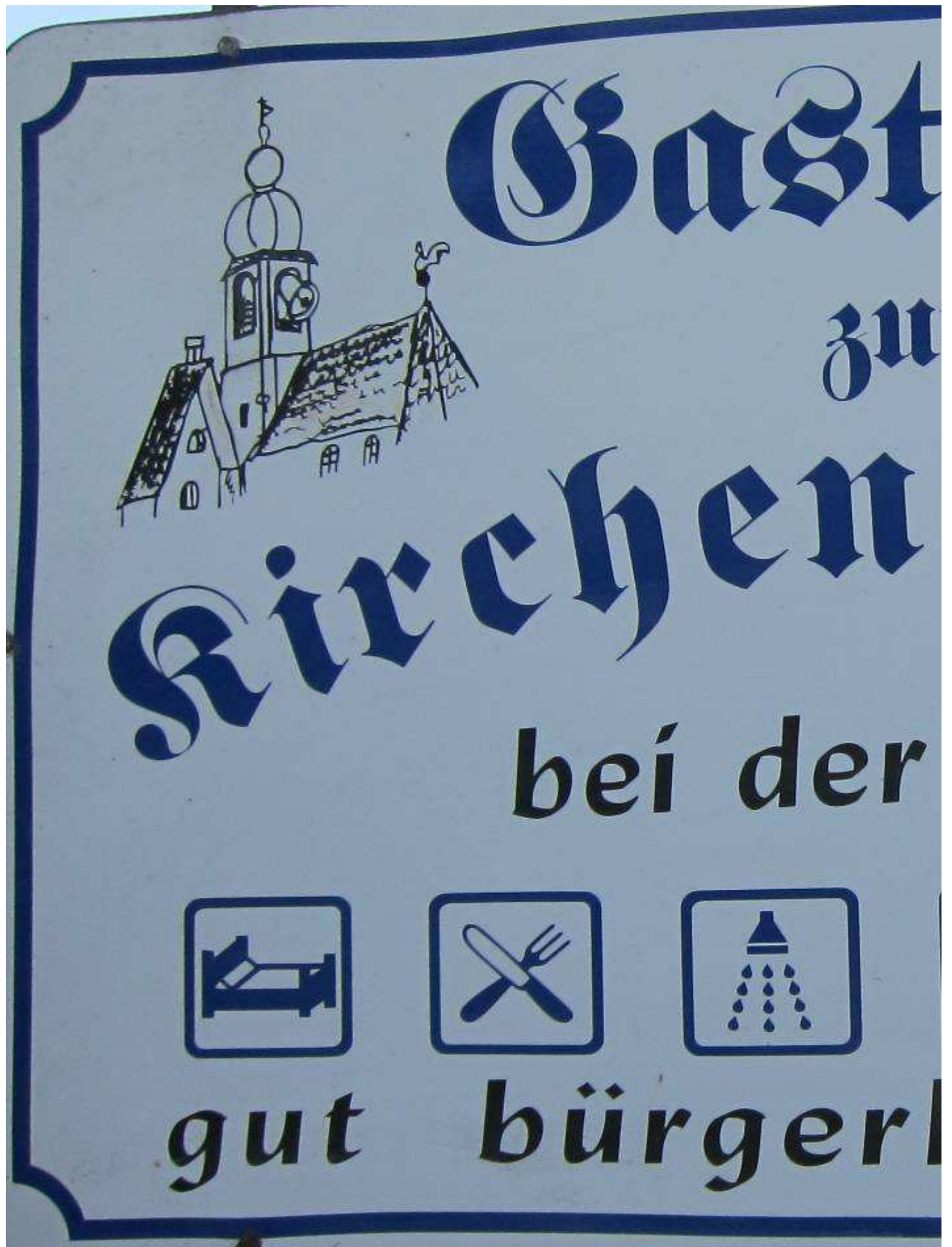
Dollnsteiner Dreifaltigkeitsdusche (unten rechts) – entdeckt bei der Fußwallfahrt der „action spurensuche“ 2013