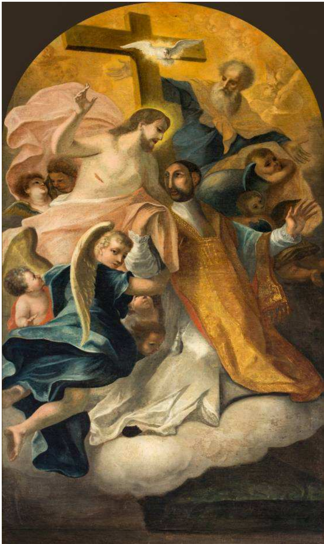
Ignatius geborgen in der Dreifaltigkeit Altarbild am Ellwanger Schönenberg, dort Vespergebet am 28.Juli 2019, 18 Uhr