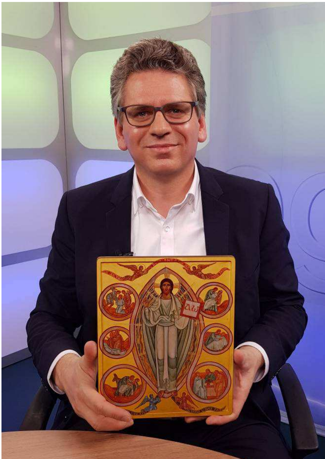
Vorstellung der Dreifaltigkeitsikone von Taizé am Sonntag, 14. Juli, 11.30 Uhr im Kapitelsaal des Klosters Wiblingen (Gottesdienst in der Basilika 10.30 Uhr)