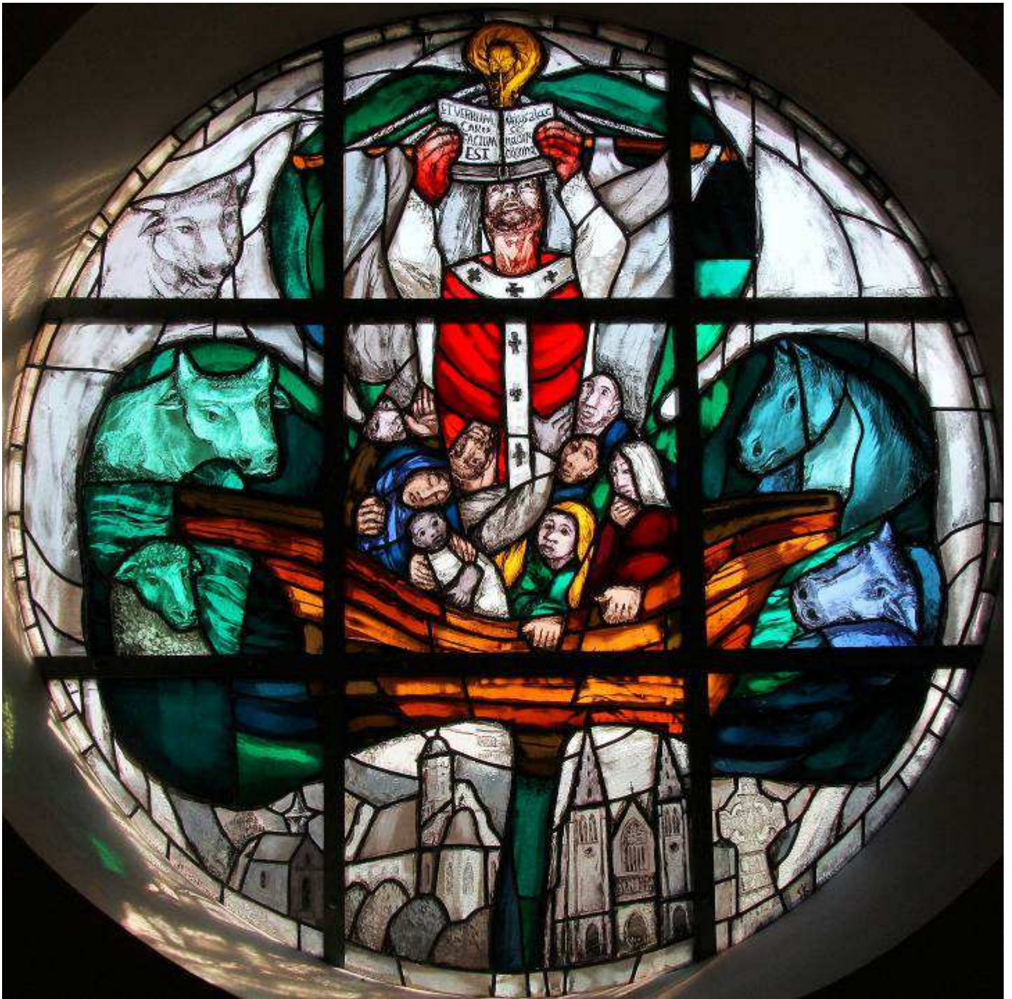
Patriziusfenster von Sieger Köder in Eggenrot: Patrick erläuterte die Trinität im Zeichen des Kleeblatts