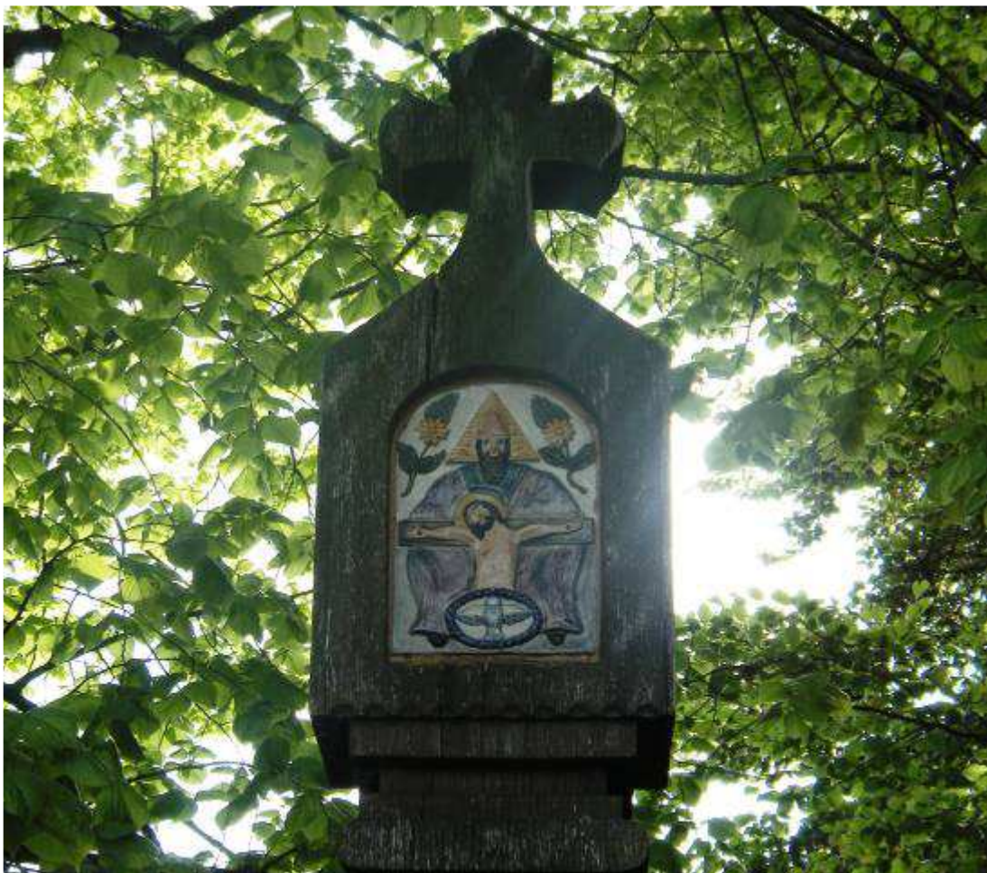
Dreifaltigkeitsstele in Westerheim

Ein auf der Spitze stehendes Dreieck symbolisiert den dreifaltigen Gott, der sich auf die Welt einlässt – in Christi Kreuz und seiner Hingabe.